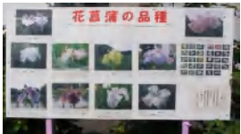
いろいろな種類の菖蒲を鑑賞してきました！