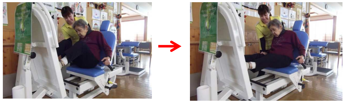
コンパクトレッグプレス：足の裏で力強く蹴って歩行の安定

第10号 MIZUHO, S 静岡市清水区長崎新田311 TEL 054-344-7711 http://www.udonosato.com/ 特別養護老人ホーム ショートステイ デイサービス 訪問介護 24時間定期巡回訪問介護看護 指定居宅介護支援事業 有度地域包括支援センター