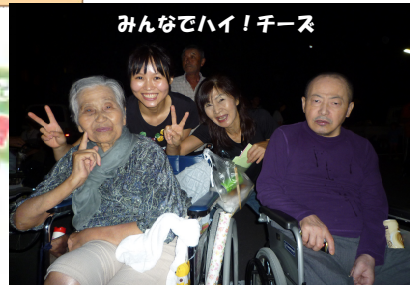
みんなでハイ!チーズ