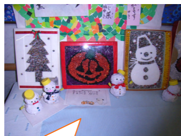
真ん中のカボチャは、雅笑2Fのみなさんの作品です

有度の里の玄関を入ってすぐのところに、『作品展示コーナー』ができました。これは、御利用者様が指先の機能訓練のために、仲間と一緒に毎日少しずつ作り上げたものです。今後も季節に応じた作品を、みんなで楽しみながら作っていきたくと思っていますので、御来所の際はぜひご覧ください。