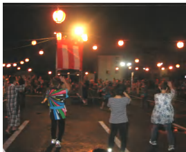
やぐらを囲んで皆で盆

盆踊りを夢中で見たり、たこ焼きを食べたり、くじ引きをしたり、普段とは違うご利用者様の表情、笑顔が沢山見ることができ、良い夏祭りになりました。