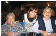
笑顔いっぱいあふれ