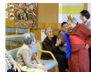
衣装に着替えましょうね