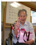
お誕生日おめでとう

3月30日(日)2階で3月のお誕生会を行いました。誕生者の方のお名前を順番にお呼びし、前に並んで頂きました。とても緊張されているご様子で、1人一言ずつお話して頂いたのですが、突然大きな声を出して嬉しさのあまり泣き出す方や今までの生い立ちを話して下さる方もおられ、とても素敵な誕生会になりました。 誕生者の方からは、「こんな素敵な誕生会を開いて頂いて、ありがとうございます。」と言って頂きました。また、来月からもご利用者が喜んでもらえるような、誕生会を開いていきたいです。